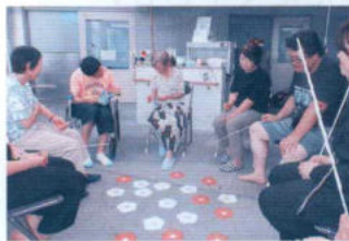
高次脳機能障害者サロン