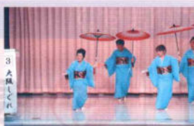
歳末たすけあい演芸大会