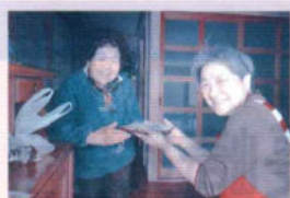
ふれあい食事サービス