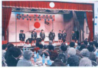
ひとり暮らし高齢者の集い