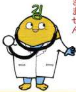
健康いさはや21応援隊マスコットキャラクター e サラおくん

40歳以上の女性には、2年に1回は必ずマンモグラフィの受診を勧めています。マンモグラフィを受けた次の年度に乳房エコー検査を受診しましょう。