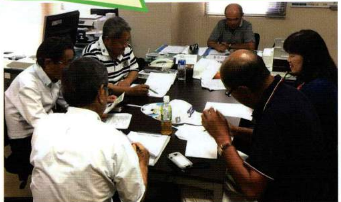
企画調整保護司会7名で活動 (一人は撮影中・・・)