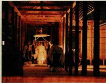
平成の大嘗祭の様子