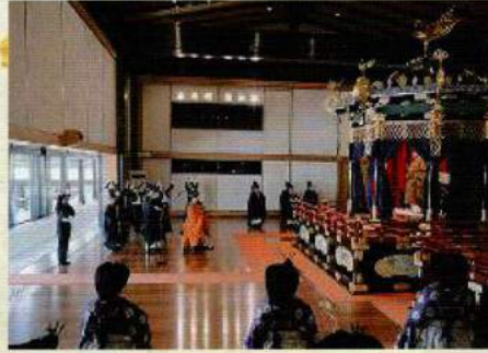
平成の即位礼の様子

改元に伴う諸行事として十月二十二日に即位礼が、十一月十四日 く十五日に一代に一度の大嘗祭が執り行われます。いずれの行事 も日本国最大の慶事です。当日は国旗を掲げてお祝いしましょう。