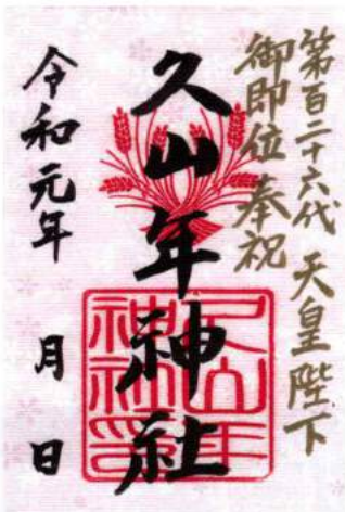
※写真は当社の書き置き御朱印

したがって頂いた御朱印は、お参りした御本人だけにしか価値の無いものがあり、ましてや御朱印を転売する事は神様を貶(おとし)める行為で、神を冒瀆(ぼうとく)している事と同じです。どうぞ感謝の気持ちを持って御朱印をお受け頂ければと思います。