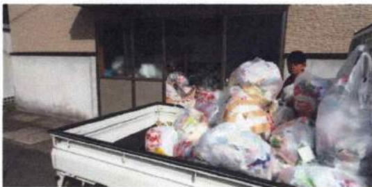
5 月 8 日早朝の状況写真

カラス等の害を受けない為と考えての回収作業ですが、 今後 8 月にも 9 連休もあることから、決められた以外での投入には今一つ考慮して頂きたいと願います。