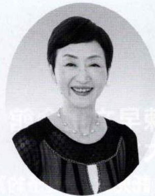
女優 柴田美保子氏

ドラマの代表作、「黄色い涙」(74年NHK銀河テレビ小説)、「ロングバケーション」(96年CX)、「ショムニ」(98年CX)、「クロコーチ」(13年TBS)、「水球ヤンキース」(14年CX)、「美女と男子」(15年NHK)、「サムライ先生」(15年ANB)、「家族ノカタチ」(16年TBS)。他ナレーションとして、「きかんしゃトーマス」(90年CX)、「王様のレストラン」(95年CX)、「クイズプレゼンバラエティー Q!!さま」(ANB)など。