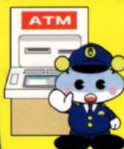
長崎県警マスコット キャッチくん