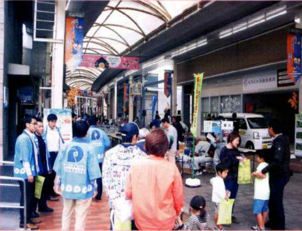
啓発チラシ等配布

10月22日、いさはやアエル中央商店街で開催された「いさはやエコフェスタ」にあわせて、啓発チラシ等の配布を行いました。