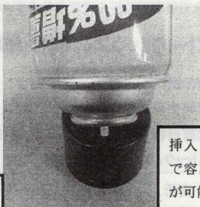
挿入し押し付けることで容易に出し切ることが可能