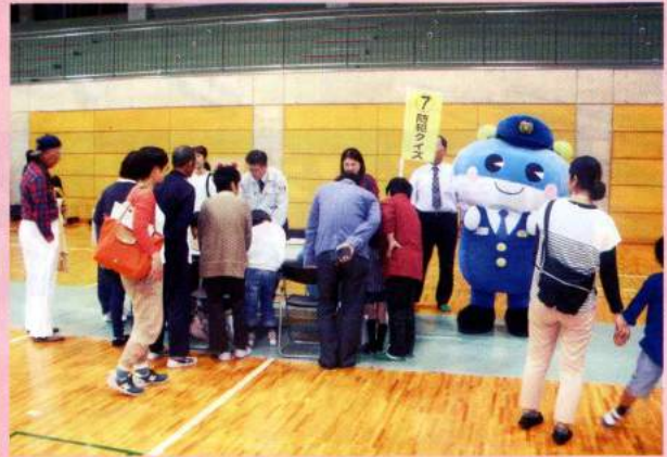
防犯クイズ、キャッチくんによる防犯啓発

11月11日、諫早市小野体育館で開催された「交通安全フェスティバル in 県央三世代交流」に参加し、防犯クイズや長崎県警マスコット「キャッチくん」による防犯啓発を行いました。