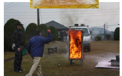
“投げ玉消火”ストライク