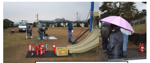
説明用として、正式消火器と消火器と呼べないものの消火器を準備