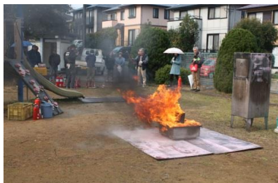
消火体験前の消火方法の説明中。