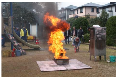
“火事で～す”と叫んで開始