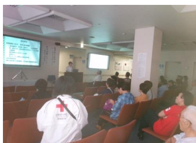
1部「肝炎治療」2部「糖尿病と認知症」の講座風景

展示物で子供たちが見たら大喜びしただろう“世界のカブトムシ・クワガタの標本が展示されていて大型「ヘラクレス」から極小のニジイロクワガタや、生きたカブトムシ「エレファントカブトムシ」の展示は珍しかったです。(日赤勤務の先生が各国回って集められたそうです)