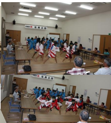
ハッピー姿で“や~れんそ~らん”板についてきましたね!