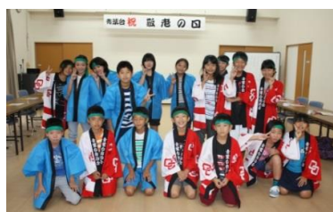
お祝いに駆け付けた子供たち

今回、対象出席者は11名で急遽都合により数名の方が欠席となり残念でしたが。対象者欠席の方々へは子供会の子供たちによって「お弁当と饅頭」をお届けして頂きました。敬老の日食事会にあたって役員・お手伝いの方、子供会の関係者の方々のご協力ありがとうございました。