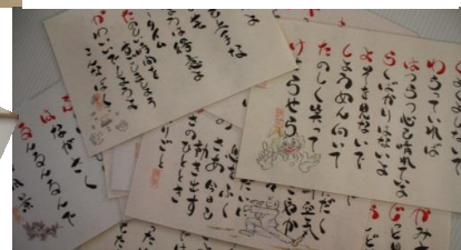
今年の色紙は、名前色紙でした。