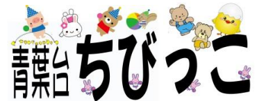
運動会用プラカード

尚、改めてご案内も致しますが、11月は第3水曜日16日(水)に変更となりますのでよろしくお願い致します。