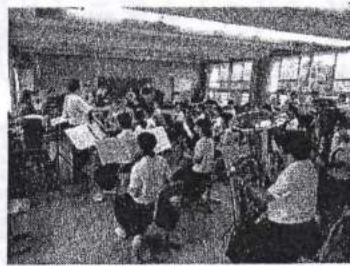
吹奏楽部の練習の様子/音楽室