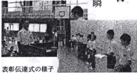
表彰伝達式の様子