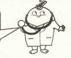
健康いさはや21応援隊 マスコットキャラクター・サラオくん

【問い合わせ先】 ○国保特定健康診査・国保若年者健康診査・後期高齢者健康診査 … 諫早市保険年金課(電話 22-1500)、各支所地域総務課 ○上記以外の健診 … 諫早市健康福祉センター(電話 27-0700)、各支所地域総務課