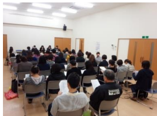
青葉台集会所にて

3 月 5 日(土)青葉台・貝津ヶ丘子ども会の総会が開催され、会長及び事務局が出席。今回までで合同での子供会児童数は青葉台 67 名、貝津ヶ丘 71 名合計 138 名での活動を終え、新年度から個々に子供会活動をするようになりました。28 年度は、児童数 71 名(総会資料より)で活動となり、貝津ヶ丘子ども会とは解散となりました。