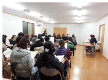
貝津ヶ丘集会所にて